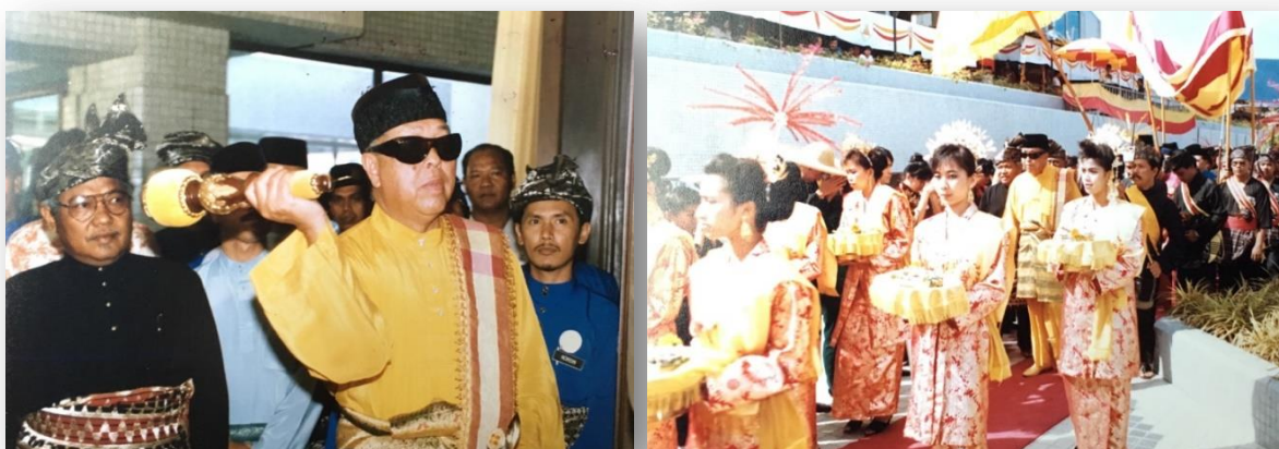
Gambar 1.3: D.Y.M.M Sultan Selangor Salahuddin Abdul Aziz Alhaj ketika Majlis Perasmian Muzium Sultan Alam Shah