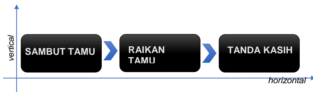
Rajah 1.0: Struktur persembahan Tarian Poja Bugis Selangor

merangkumi tiga bahagian untuk melengkapkan sebuah persembahan Tarian Poja, iaitu Sambut Tamu, Raikan Tamu, dan Tanda Kasih (Rujuk Rajah 1.0). Setiap bahagian mempunyai beberapa gerakan yang melambangkan setiap struktur bahagian dalam Tarian Poja Bugis, Selangor.