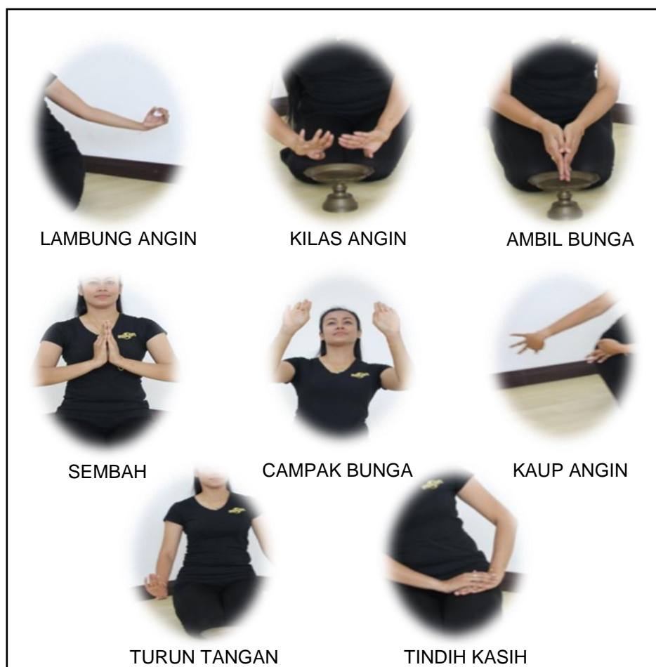
Gambar 1.4: Posisi pergerakan tangan di Bahagian Sambut Tamu

Struktur bahagian ketiga dan terakhir, iaitu Tanda Kasih merupakan sebuah tanda bermotifkan terima kasih kepada tetamu yang hadir sambil memperlihatkan motif semoga dapat bertemu kembali jika diizinkan Allah di majlis yang akan datang. Penari akan mengambil dupa kembali yang sebelum ini diletakkan di lantai serta di hadapan penari sebelum bangun secara perlahan-lahan setelah melakukan pergerakan lambung angin untuk keluar sambil menaburkan semula bunga rampai yang dibawanya. Penari akan melakukan pergerakan lenggang ombak beralun untuk mengiringi dan menabur bunga rampai di sisi kanan sehingga keluar dengan jengkit lari anak sebagai tanda terima kasih kepada tetamu yang hadir pada majlis tersebut. Sila rujuk Gambar 1.6 dan Rajah 1.3 untuk melihat visual kedudukan postur, gestur tubuh dan kedudukannya