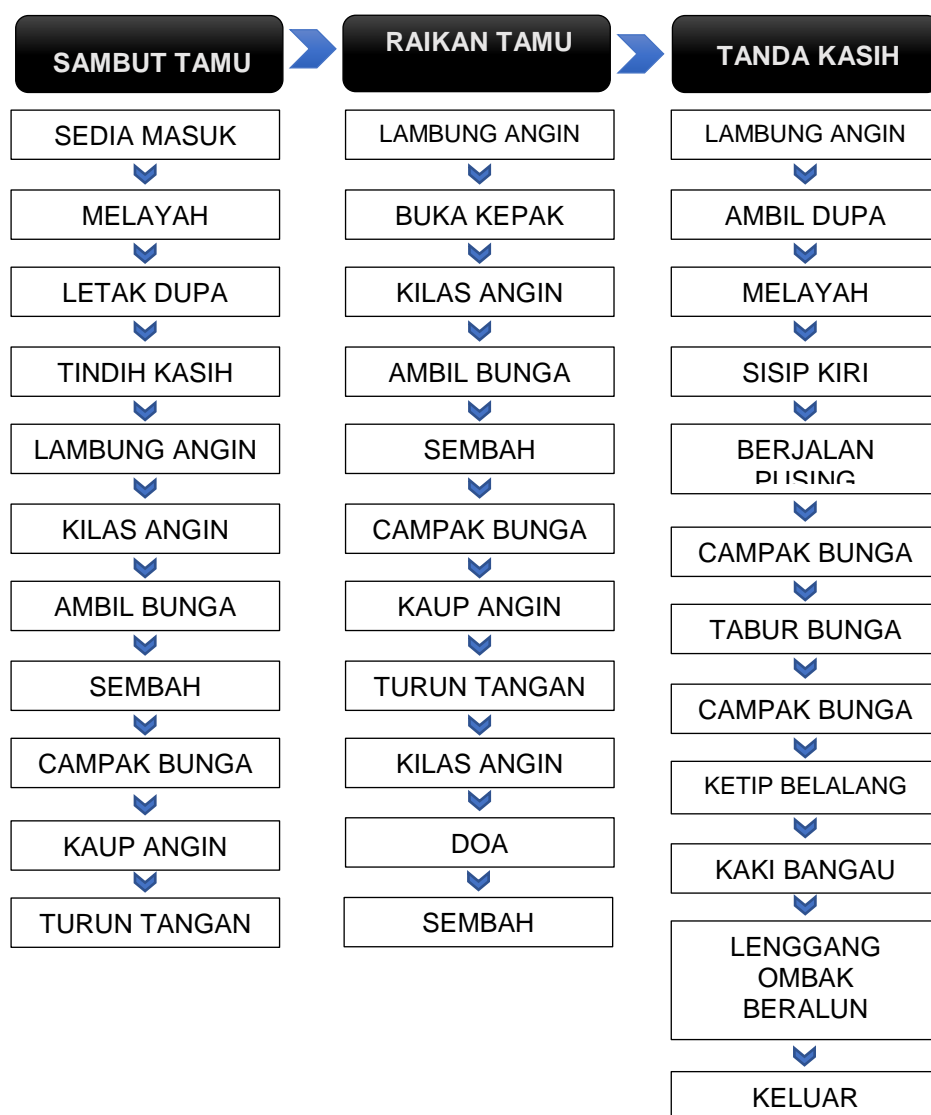
Rajah 1.4: Struktur persembahan dan pergerakan Tariyan Poja Bugis Selangor

Rajah 1.4 memperlihatkan secara keseluruhannya tentang fungsi pergerakan lambung angin yang merupakan sebuah pergerakan yang dilakukan sebagai suatu tanda atau simbol pertukaran ke bahagian seterusnya melalui tiga bahagian struktur persembahan Tariyan Poja. Terdapat 13 pergerakan posisi tangan yang di gunakan di dalam Tariyan Poja Bugis Selangor, iaitu sedia masuk , letak/ambil dupa , tindih kasih , lambung angin , kilas angin , ambil bunga , sembah , campak bunga , tabur bunga , kaup angin , turun tangan , buka kepek dan doa . Manakala dalam pergerakan posisi kaki pula, terdapat sembilan posisi kaki (Gambar 1.6) yang digunakan, iaitu berdiri , berlutut , berjengket , melayah sisi , sisip kiri , kaki bangau , ketip belalang , duduk atas tumit dan duduk berlutut merujuk kepada Jadual 1.0 yang menggariskan susunan pergerakan pada posisi tangan dan kaki dalam Tariyan Poja Bugis Selangor.