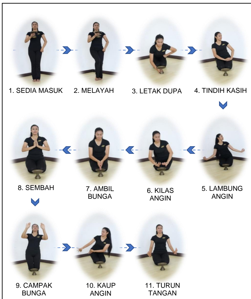
Rajah 1.1: Visual kedudukan postur dan gestur tubuh di Bahagian Sambut Tamu