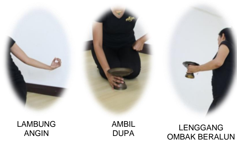
Gambar 1.6: Posisi pergerakan tangan di bahagian Tanda Kasih