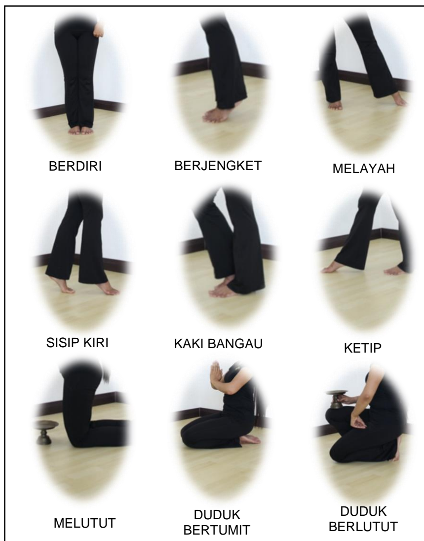
Gambar 1.6: Posisi pergerakan kaki