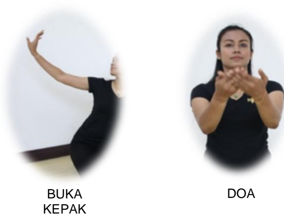
Gambar 1.5: Posisi pergerakan tangan di Bahagian Raikan Tamu