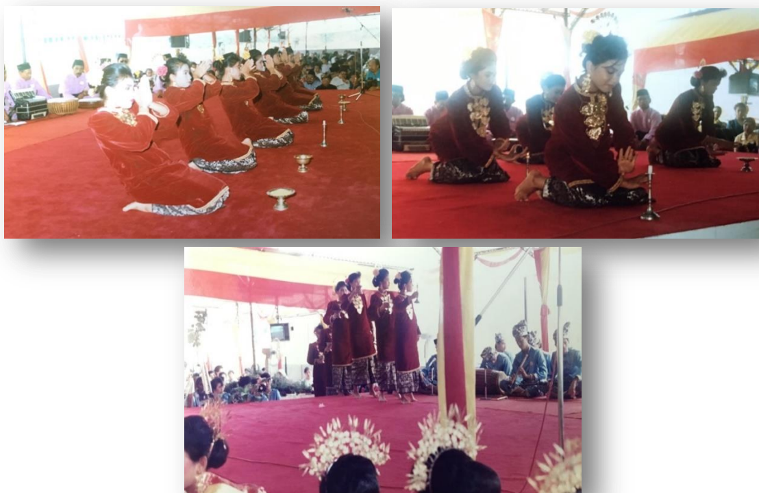
Gambar 1.2: Persembahan Tarian Poja ketika Majlis Perasmian Muzium Sultan Alam Shah

empat tarian, iaitu Tarian Poja, Tarian Pattenun, Angin Mamiri dan Pajoget yang diiringi dengan muzik telah dipersembahkan di Majlis Perasmian Muzium Sultan Alam Shah, Selangor pada 2 September 1989.