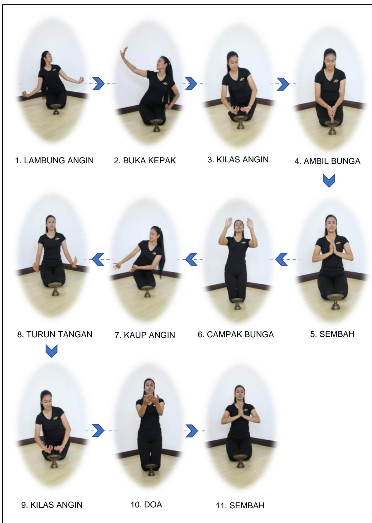
Rajah 1.2: Visual kedudukan postur dan gestur tubuh di Bahagian Raikan Tamu