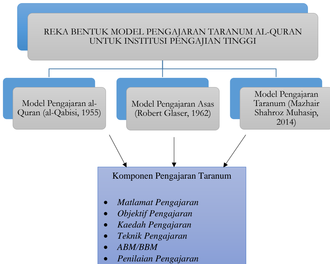
Rajah 4: Kerangka Model Kajian

Pengkaji turut memilih model sandaran iaitu dengan mengadaptasi Model Pengajaran Taranum (Mazhair Shahroz Muhasip, 2014) yang terdiri daripada enam komponen pengajaran merangkumi matlamat, objektif, kaedah, teknik, abm/bbm dan penilaian. Hasil gabungan ketiga-tiga model pengajaran tersebut membentuk enam komponen MPTQ untuk IPT dalam kerangka model konseptual kajian seperti yang tertera dalam rajah 4 di bawah: